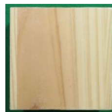
塗装後 透明で木目が見える